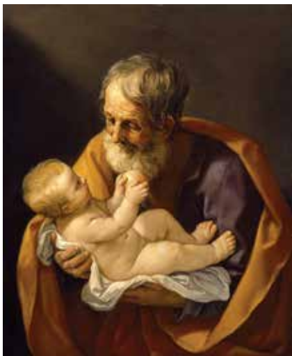
Dans les bras de Joseph, Guido Reni (1635)

Cette interrogation était au centre du cycle biblique qui vient de s'achever. Vous vous doutez que nous n'avons pas trouvé « La Réponse ». C'est une bonne nouvelle car notre quête continue. Cette recherche est au cœur même de notre foi. Elle nous renvoie à cette nuit de Noël ou nous rencontrons :