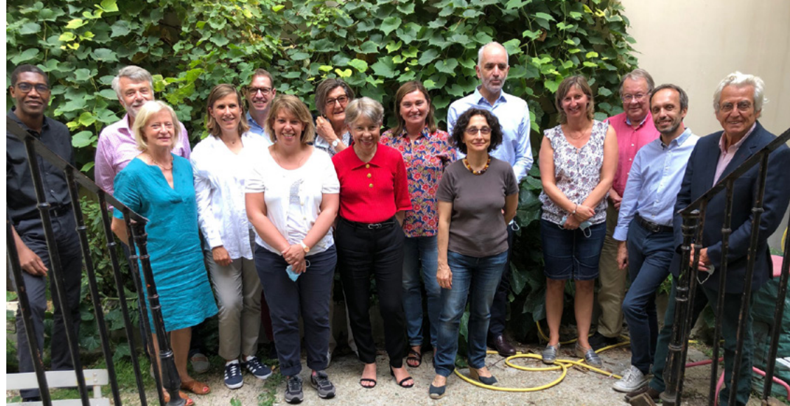
Les membres du conseil presbytéral

L'Église est une organisation humaine de chrétiens se réunissant pour vivre ensemble leur foi et pour se donner les moyens d'avoir une aide dans leur propre recherche. L'Église a également pour mission le secours aux plus démunis sur le plan matériel et spirituel. Elle est organisée démocratiquement, avec un système de délégués élus à des conseils et des synodes.